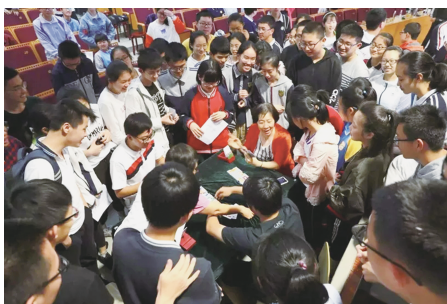
桥牌世界冠军、世界特级大师古玲 同二中桥牌社团的同学切磋

5月21日，杭州二中学生桥牌社团宣布成立，这意味着杭州二中的校园里又多了一个有益、有趣、有智的学生团体。