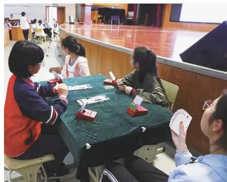
活动现场同学们被深深吸引

国家级桥牌讲师、世界大师朱小音女士是第一代国家女队的主力队员，她通过图文并茂的课件和激情洋溢的讲述为同学们讲解了桥牌文化知识、桥牌基础知识及基本打法等内容。并且积极地与同学们互动，现场指导了两桌同学进行了桥牌演示，同学们兴致勃勃，收