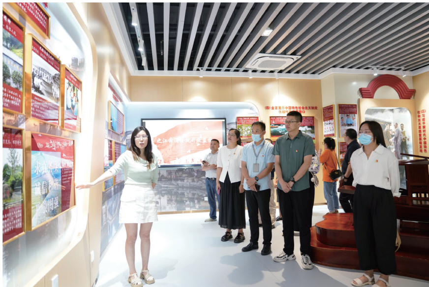
将牢牢把握“学思想、强党性、重实践、建新功”的总要求,努力把学习成果转化为推动学院事业发展的动力。

此次主题党日活动的开展,目的是让党员教师们对习近平新时代中国特色社会主义思想有更加深刻的理解,进一步坚定理想信念,凝聚奋进力量,通过循迹溯源,学思想促践行。党员教师们纷纷表示,通过近距离感受总书记对职业教育发展的期待,深切地感受到职业教育未来可期,深刻地感悟了真理伟力,大家